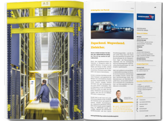
1/1 Seite + Anzeige