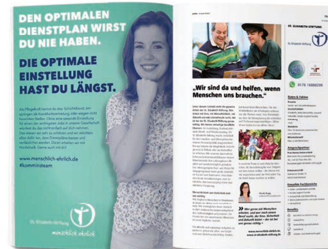
1/1 Seite + Anzeige